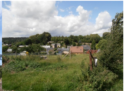
Le village de Fontaine la Soret