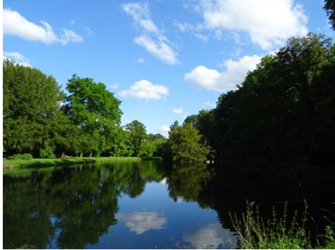
L'étang du parc