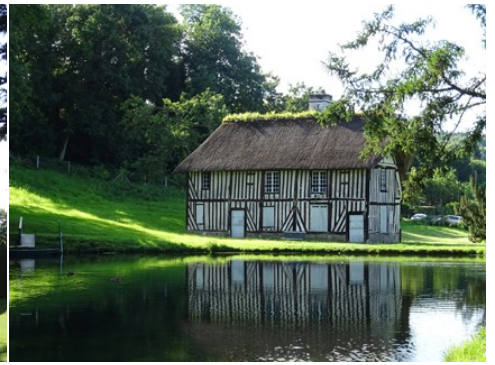
Un pavillon du parc au bord de l'étang