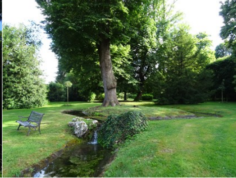
Le cours d'eau traversant le domaine