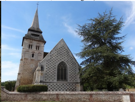
L'église de Fontaine la Soret