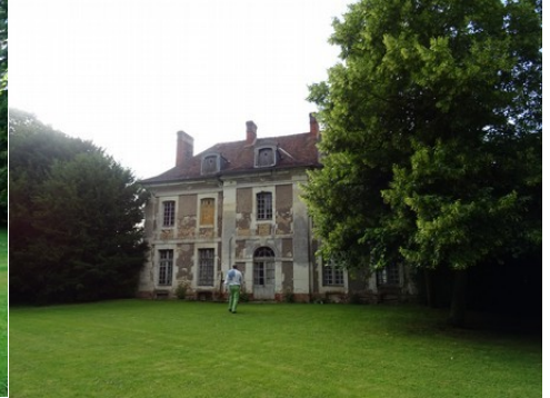
Une dépendance du château

Pour la zone en rose foncé dans le périmètre de 500m