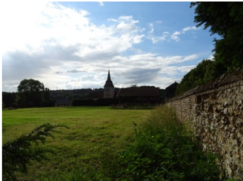
L'église vue du domaine

Les avis seront cohérents avec ceux émis ces dernières années, à savoir : pas de maisons à volume compliqué (type V, W, Y, ou Z), pentes à 45° pour les volumes principaux, ardoise ou tuile plate de teinte brun vieilli, à 20u/m 2 , avec un débord de toiture de 20cm, enduit de teinte beige clair avec modénatures (au choix : chaînages, encadrement de fenêtres, soubassement, colombage...). *Voir les autres fiches.