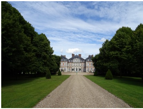
La façade est avec l'allée d'honneur