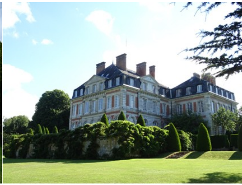
Le château vu depuis le Nord-Est